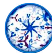
MOLÉCULA DE 8 BRAZOS CORTOS