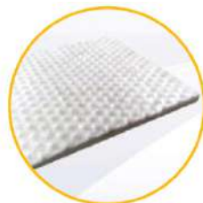
99% Colágeno Tipo I