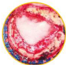
Suturable y Onlay