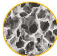
Matriz 3D porosidad controlada